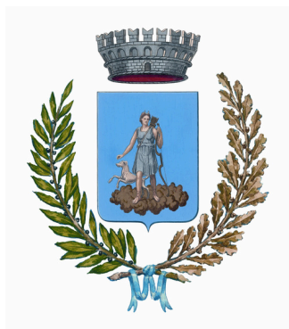
Comune di Valdobbiadene